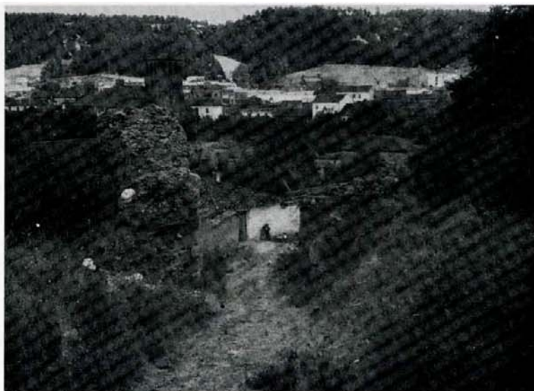
Saldaña: puerta de la muralla.