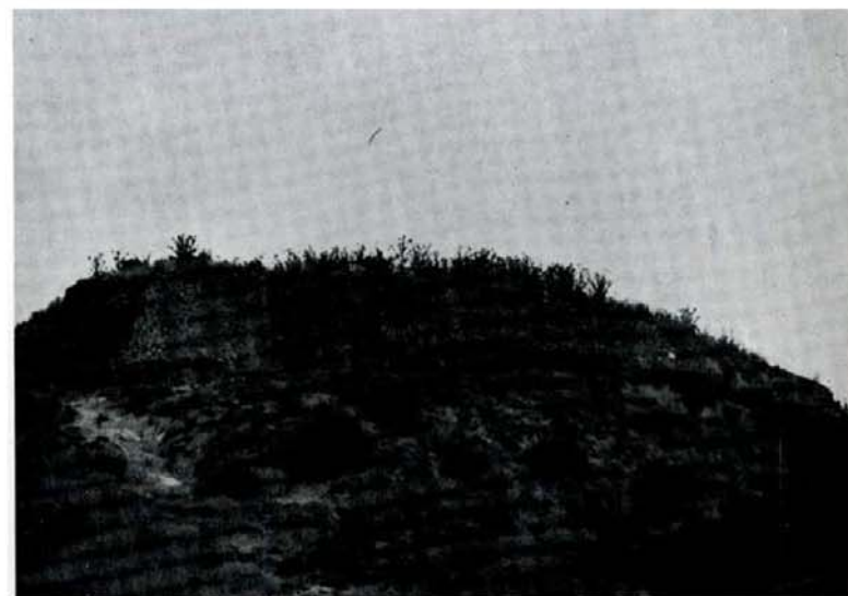
Saldaña: cerca superior.