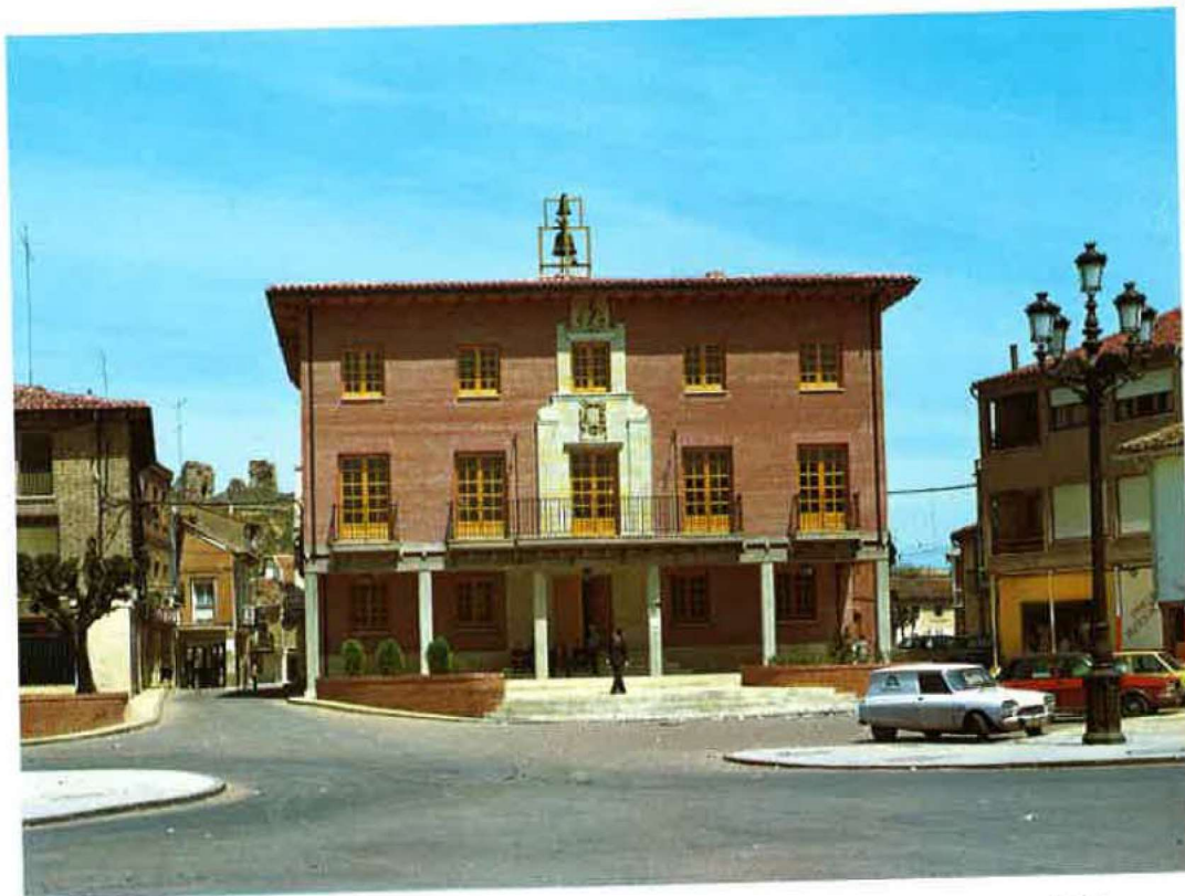
ACTUAL CASA CONSISTORIAL DE SALDAÑA, «PALANCA PARA EL PROGRESO DE LA COMARCA».