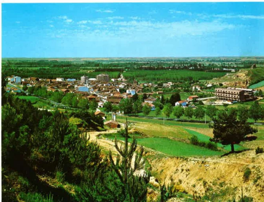
...« DONDE SE ABRE LA VEGA FECUNDA»...