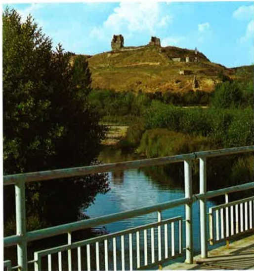
«COLINA DE LA MORTERONA, ASENTAMIENTO DEL CASTILLO»