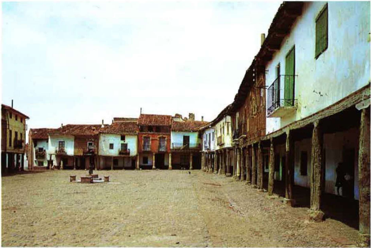
LA PLAZA VIEJA ANTES DE LA ULTIMA RESTAURACION